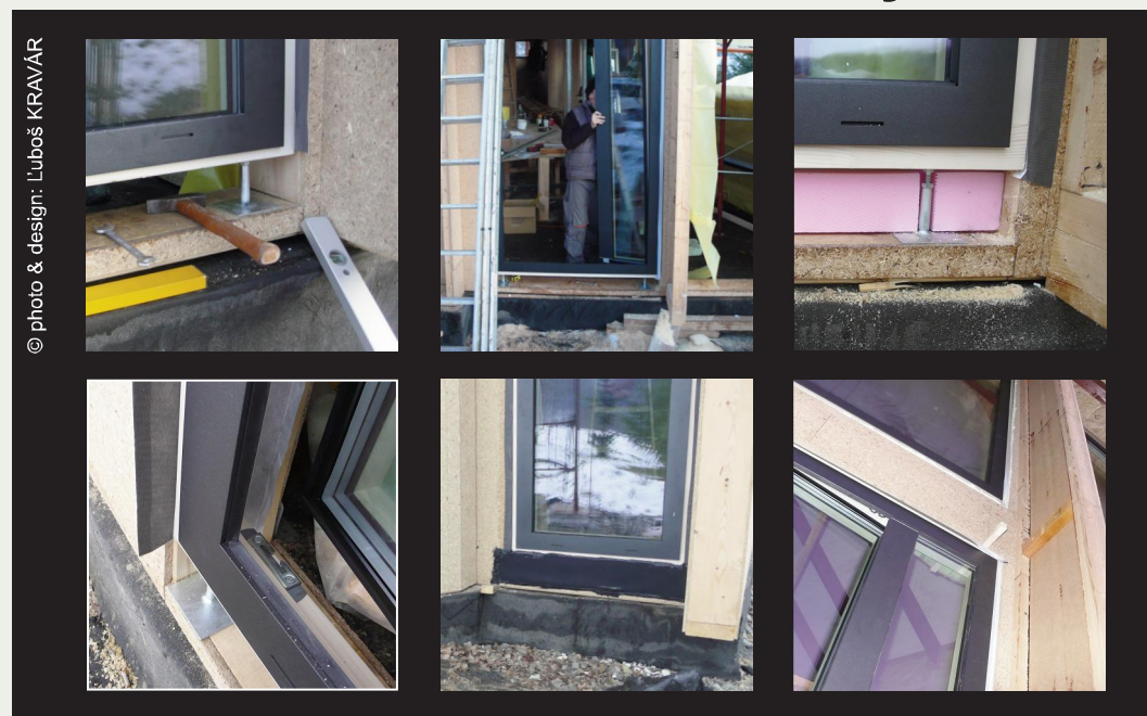
drevohliníkové balkónové dvere - Makrowin MW Integral