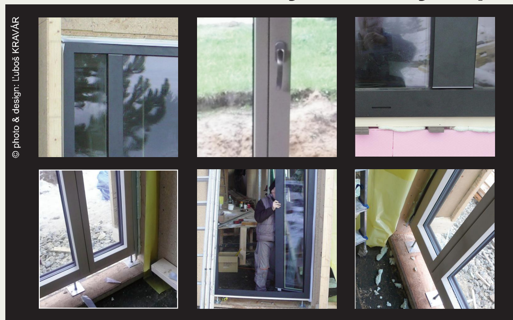
subtilný stredový stĺpik balkónových dverí - MW Integral